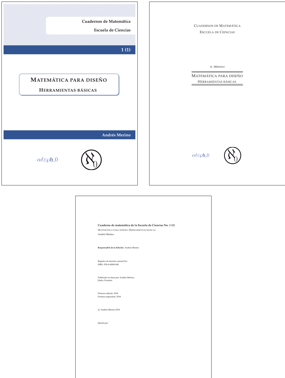
Figura 3: Ejemplo de libro

También se pueden generar más ambientes de teoremas, con otros formatos y colores, siguiendo los siguientes ejemplos (con título aparte, por el momento, todos los ambientes deben numerarse por capítulos y sus respectivos contadores deben ser redefinidos como se muestra). Para el estilo clásico: